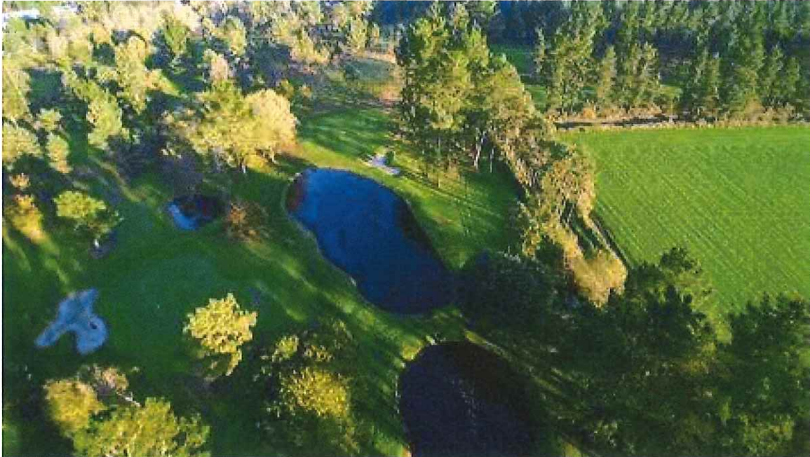
Se han eliminado filas de árboles en ambos lados de algunas de las calles, consiguiendo así más luz

D ebido al enorme trabajo y esfuerzo realizado por los responsables del Campo de Golf del G.B. Guitiriz, hemos decidido dedicar el espacio destinado a la Noticia Albatros de este número de nuestra revista a las diversas mejoras realizadas en el mencionado campo en los últimos meses, con el objetivo de convertirlo en un recorrido más operativo.